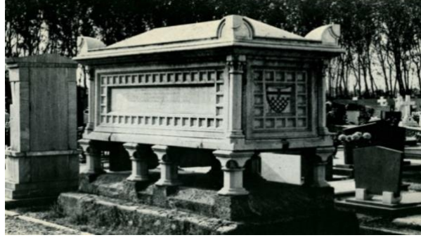
Resim 5. Prenses Belgiojoso'nun Mezarı, İtalya Milano (Chiyong, 2014, s. 46, fig. 1.7)

Yazışmalardan anlaşılacağı gibi Prenses Belgiojoso 1871 yılında vefat ettikten sonra kızı Maria, kısa bir süre daha Anadolu'daki çiftlik ve tarlaları için resmi makamlarla yazışmalar gerçekleştirmiştir (Bakınız Resim 4). Maria'nın yazışmaları neticesinde cevap alamadığı ve annesi Belgiojoso kadar mücadeleci olmadığı düşüncesiyle mülklerinden vazgeçtiği düşünülmektedir.