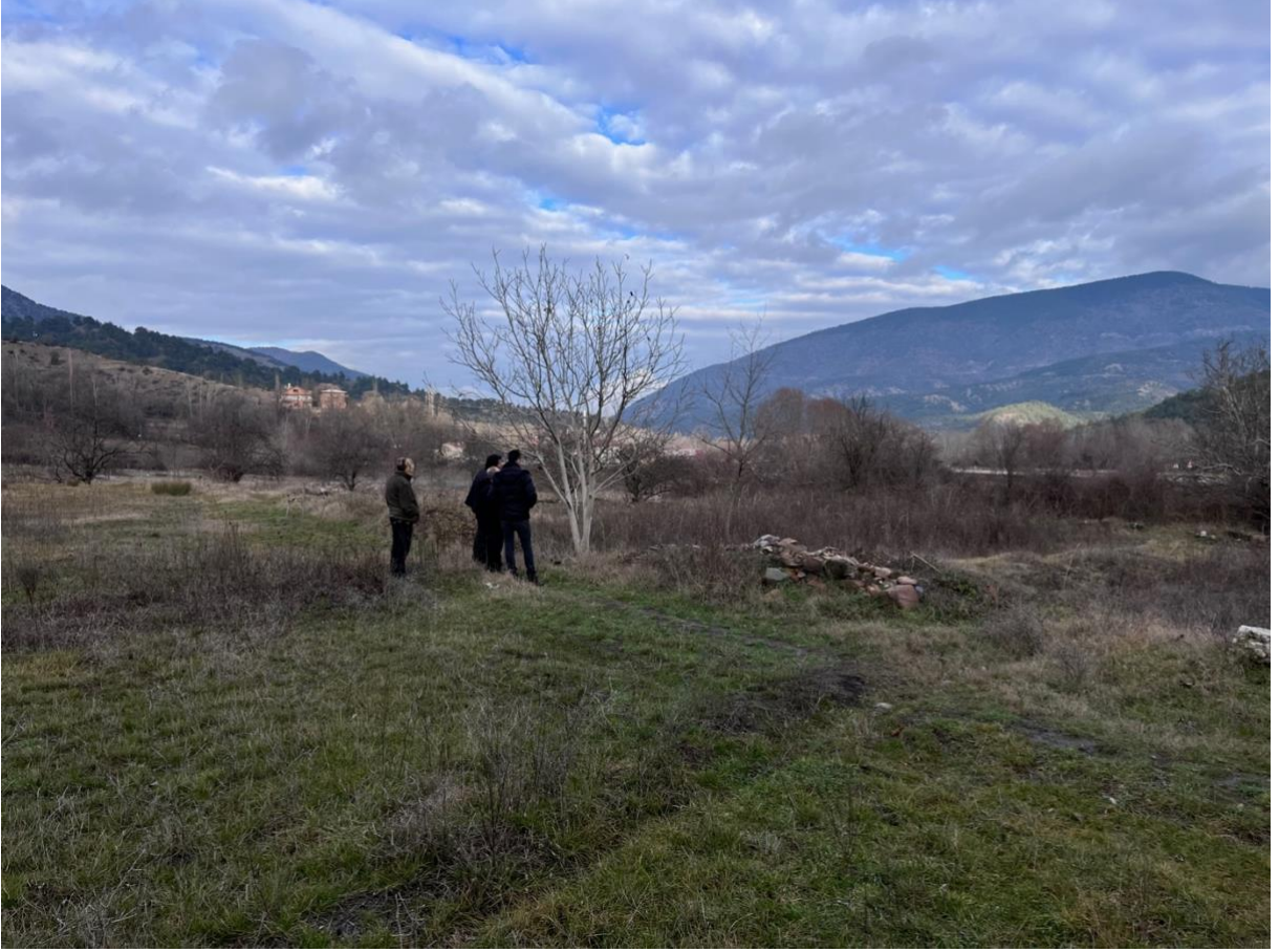
Resim 4. Yüzeý araştırması için bulunduđumuz Acıöz Köyü'nde Macar Maria'nın evinin yeri olarak gösterilen arazi. Burada 1970lere kadar oldukça büyük iki katlı bir ev varmış; yıkılmış. Daha sonra müze görevlileri gelip taşlarını toplayıp götürmüşler. Kanımızca bunlar devşirme (spolia) malzeme olabilir. Daha sonra defneciler yeri kazarak arama yapmışlar. Koordinatlar: 41,01716° N, 32,62437° E.

belirtilmiştir 24 . 07.01.2023 tarihinde gerçekleştirilen saha çalışmalarında “Macar Maria” olarak adlandırılan Prensess Belgiojoso'nun kızına ait arsaların son 150 yıl içerisinde defalarca el değiştirdiđi günümüzde ise üzerinde birçok kişinin arsasının bulunduđu ifade edilmiştir 25 .