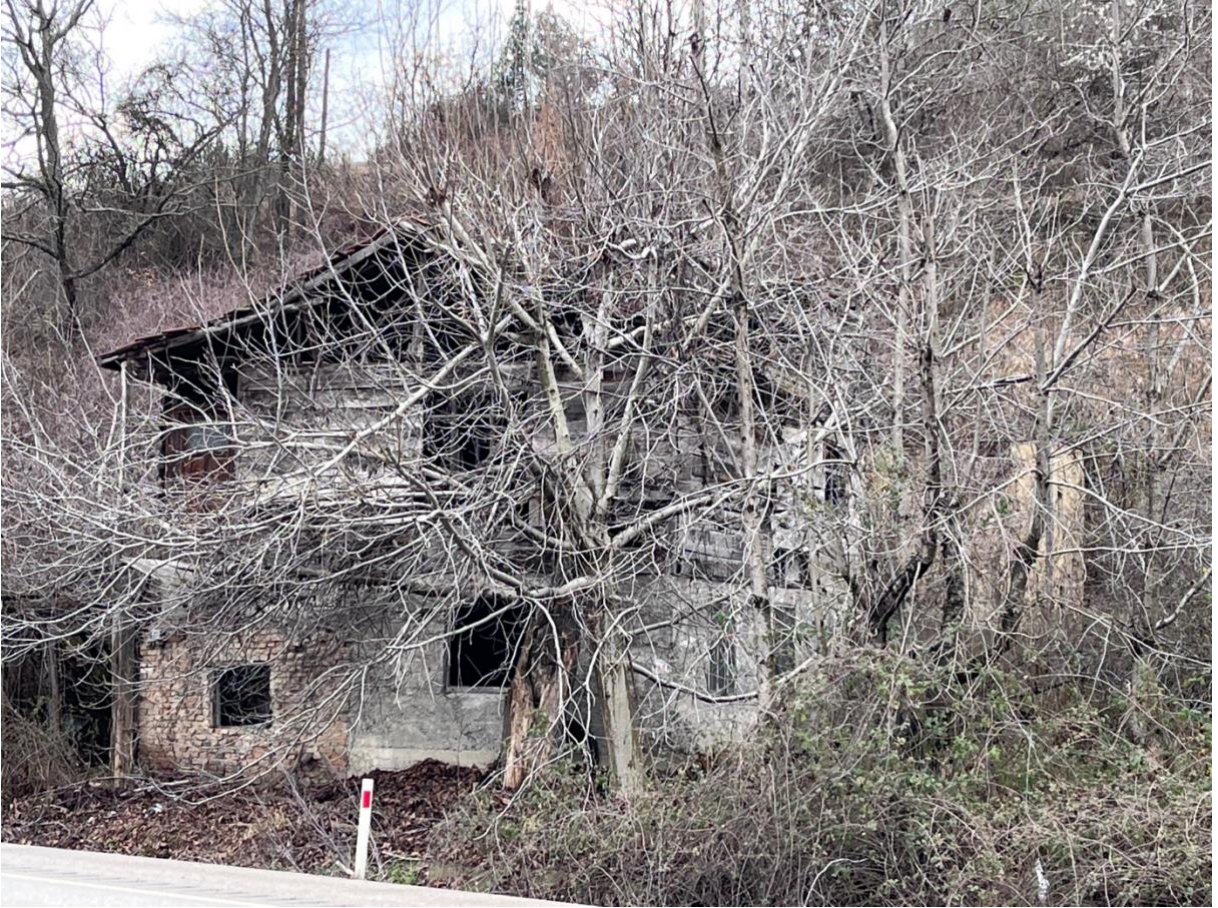
Resim 2. Su değirmeni. Değirmen yakın zamanlar kadar işletilmekteymiş. Konum: 41,01383° N, 32,62576° E.

yanı ise Sat Köy(?) ile dağ ve bir değirmene kadar ulaşmaktadır 15 (Babuçoğlu & Özdi, 2022, s. 26). (Bakınız Resim 2).